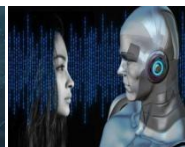
Ideologia transumanesimo - foto a sinistra- umano robot reali